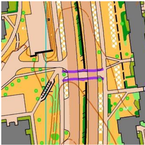
Gatvės kirtimo pvz.

Svarbu! Trasoje bus dirbtinės kliūtys, kurias kirsti griežtai draudžiama. Ant žemėlapio tokios vietos pažymėtos simboliu 708 kartu su 709. Realybėje ant žemės šonuose bus ryškūs kūgeliai iš abiejų takelio pusių.