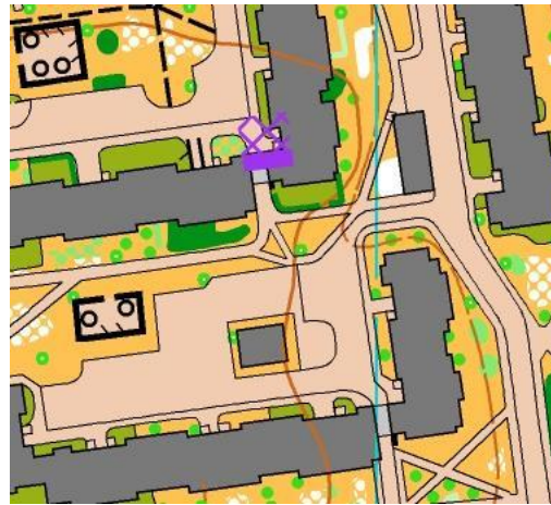
Draudžiamos kirsti vietos pvz.